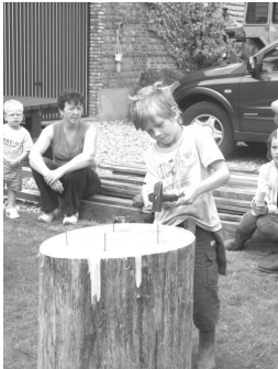
WZT 2009: een praktische proef

De boerengazet (Bgz): “Meester, ik herinner mij