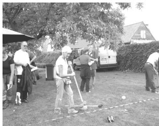
WZT 2009 een sfeerbeeld

Mr: "Oh, maar, wacht, omdat er dikwijls stof, muizen of ander ongedierte naar beneden viel, plaatste men vier palen aan de hoeken van het bed, spande er een laken over en zo ontstond het "HEMELBED"