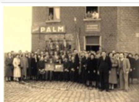
DE GILDE JAREN 50